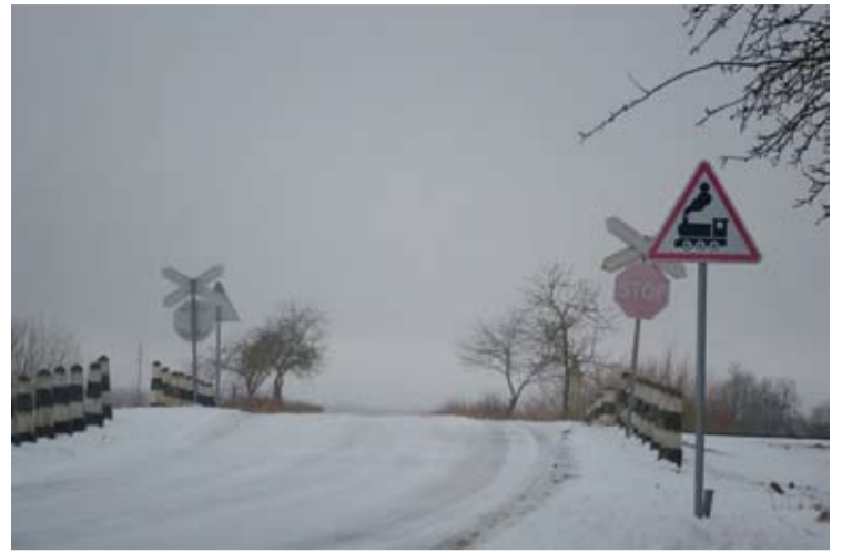
Prie pervažos sutikti traukinuką - šiais laikais jau gana netikėtas dalykas.