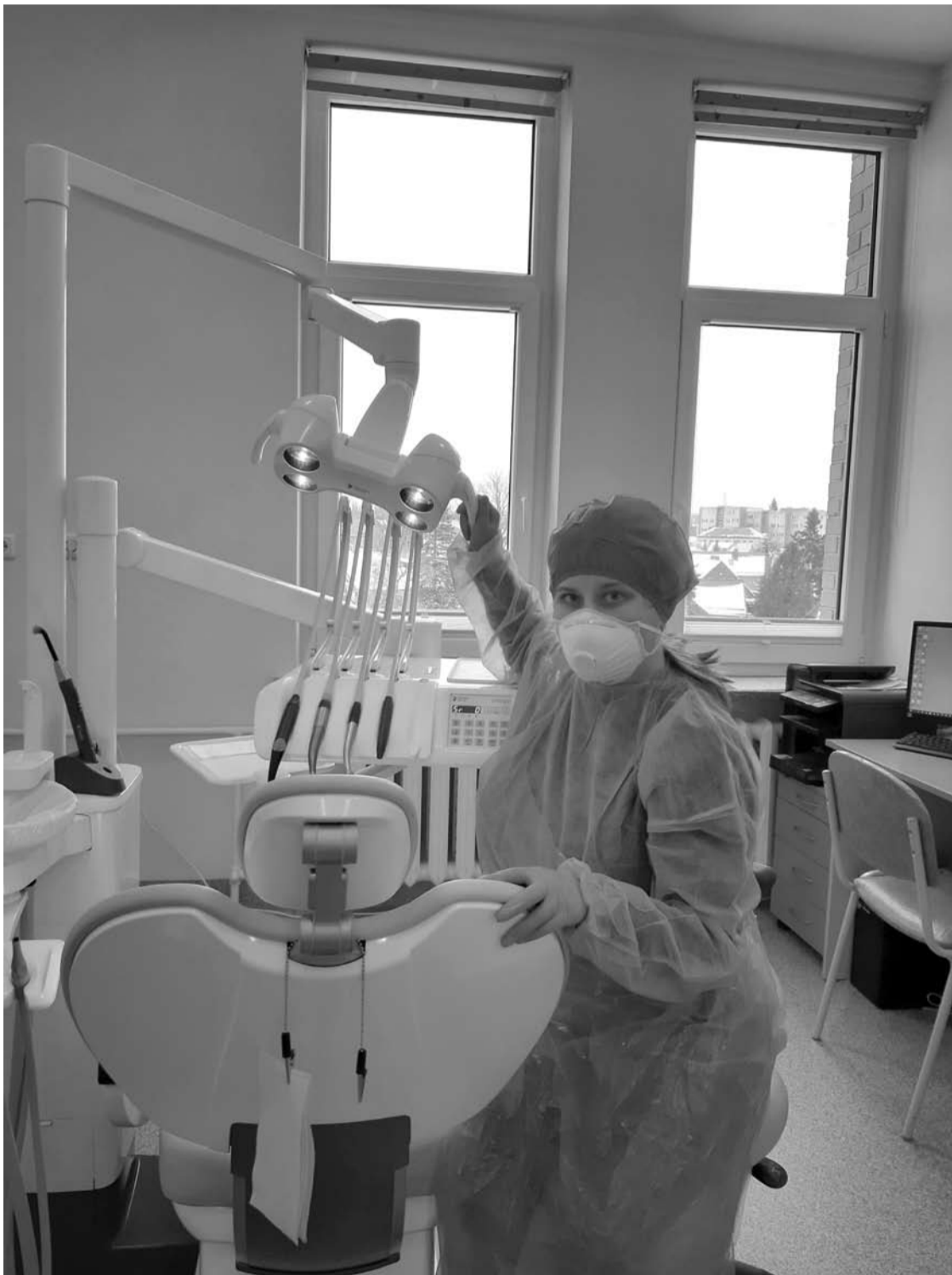
Poliklinikos odontologų kabinetai aprūpinti šiuolaikine įranga.