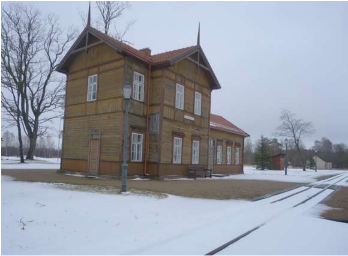
Surdegio geležinkelio stotis 2011-2014 sulaukė investicijų - pakeistas pastato stogas, paremontuotas stoties vidus, sutvarkytas peronas.